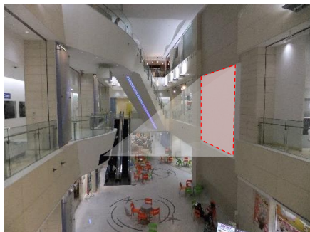
▲放映の様子イメージ（施設内の吹き抜け部）

施設のある吹き抜け空間に面して、250インチの大画面で投影可能な高性能プロジェクターを導入し、海中映像やスポーツ試合など臨場感のある様々な映像をお届けいたします。※放映内容は変更となる場合がございます。