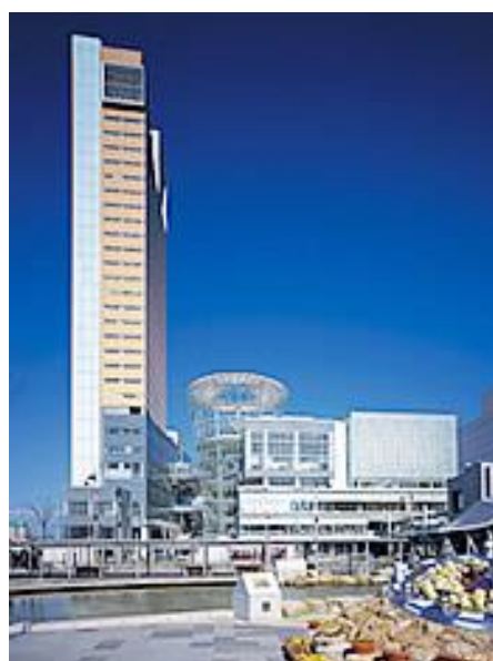
高松シンボルタワー外観