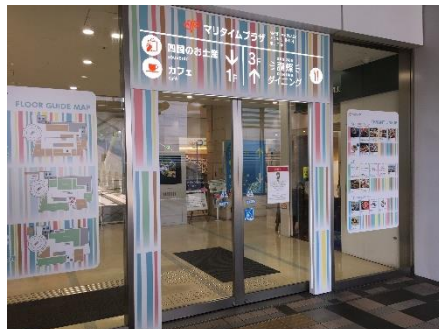
▲JR ホテルクレメント連絡ブリッジ側扉のゲート。電飾看板とし視認性も向上。