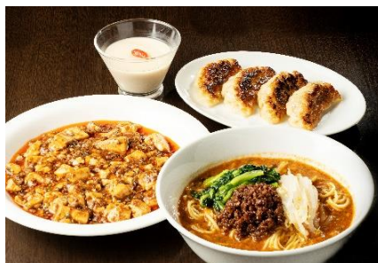
▲麻婆豆腐と担々麺がセットに！