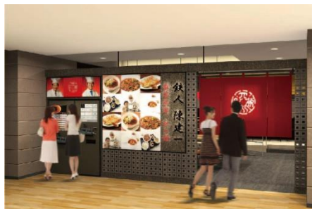
▲店舗外観イメージ