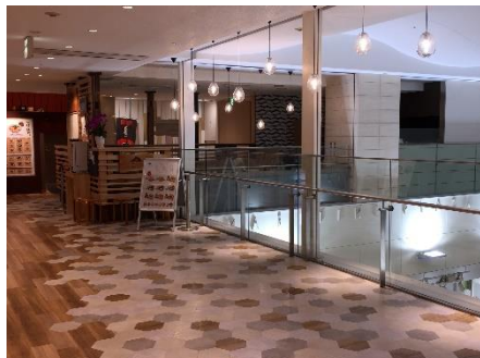
▲波打ち際をイメージしたデザインの床仕上げ、温かみのあるペンダントライトも新設。

讃岐の街に燦々と光が降り注ぐような風景をイメージし、ポップかつ温かみのある配色に刷新した空間が、皆様をお出迎えいたします。